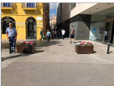
Fioriere posizionate per consentire il passaggio di veicoli.