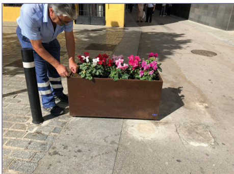
Dettaglio di apertura del blocco della fioriera.

Fioriera di sicurezza antisfondamento costruita appositamente per resistere agli atti vandalici causati dall'intrusione di veicoli.