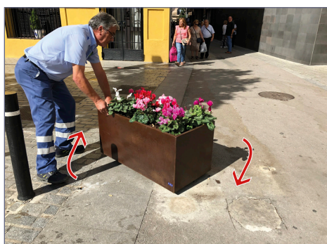
Avvio del sistema di rotazione della fioriera.

Realizzazione del modello di fioriera richiesto dal cliente, adattandolo ai sistemi di sicurezza necessari.