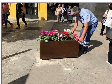
Dettaglio per il bloccaggio della fioriera nel punto finale.

Possibilità di adattare le nostre fioriere a fioriere autoirriganti.