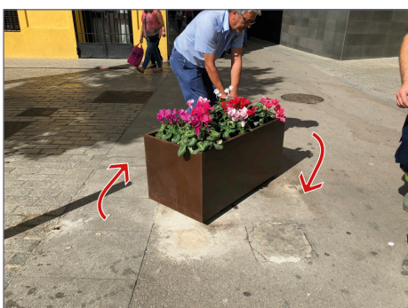
La fioriera ruota di 360°. Si può scegliere il verso della rotazione al momento dell'installazione