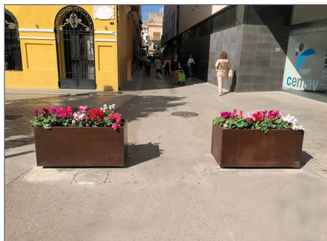
Fioriere posizionate al fine di non permettere il passaggio di veicoli.