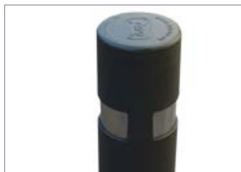
Dettaglio rinforzo dissuasore per evitare la rottura nella parte superiore.