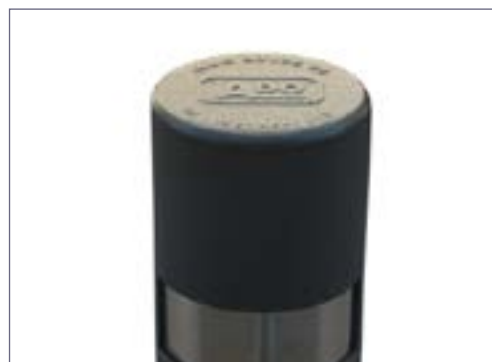
Dettaglio logo inciso sul dissuasore.