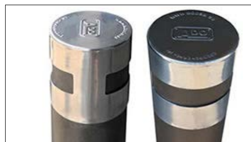
Dettaglio parte superiore dissuasore Urban.