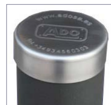
Dettaglio parte superior e dissuasore tap.