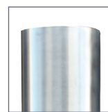
Opzione opaco / satinato.