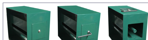
Apertura del distributore di sacchetti mediante chiave Torx in dotazione.