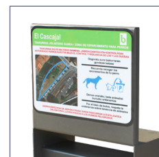
Pannello superiore per cartelli.