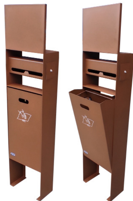
Rif. PBOXIC01 + Rif. SBCARPI

ADO, si riserva il diritto di modificare le specifiche dei prodotti senza preavviso.