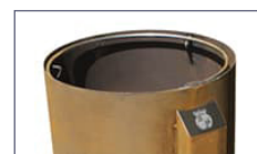
Aro sujeción bolsas.